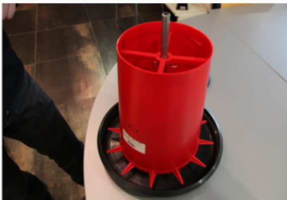
5. Coulissez le cône sur la tige et mettez la goupille de réglage