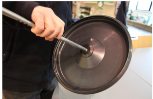
4. Vissez la tige