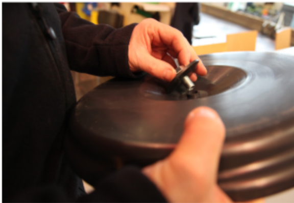
3. Boulon + rondelle sur le socle