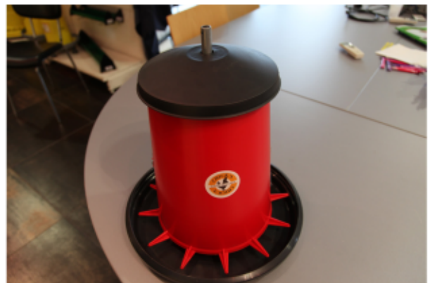
6. Mettre le chapeau