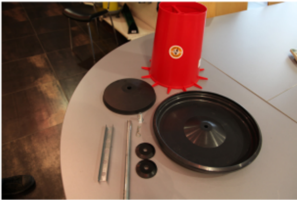
1. Rassemblez toutes vos pièces